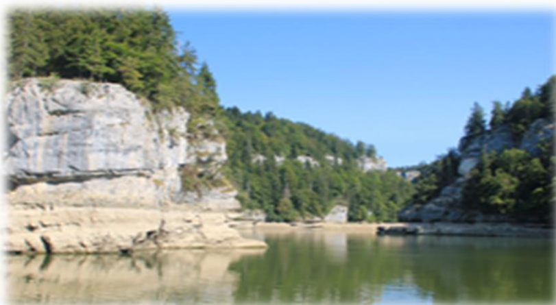
Lors de la balade en bateau sur le Doubs